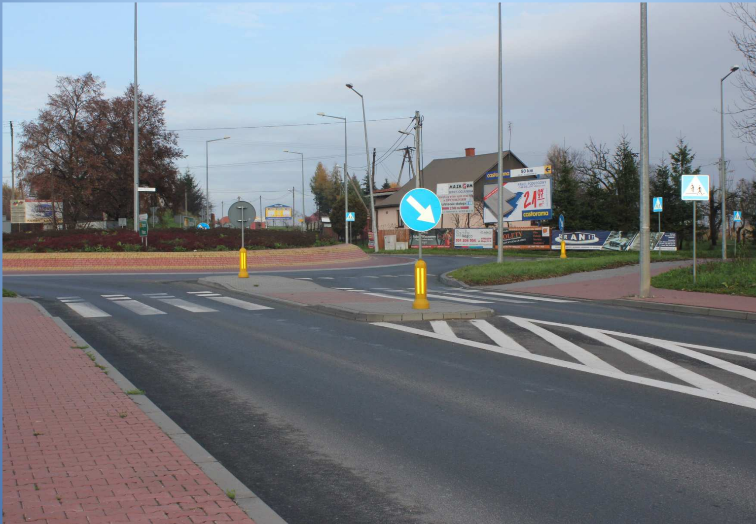
m. Staszów rondo na skrzyżowaniu dróg nr 764 i 757