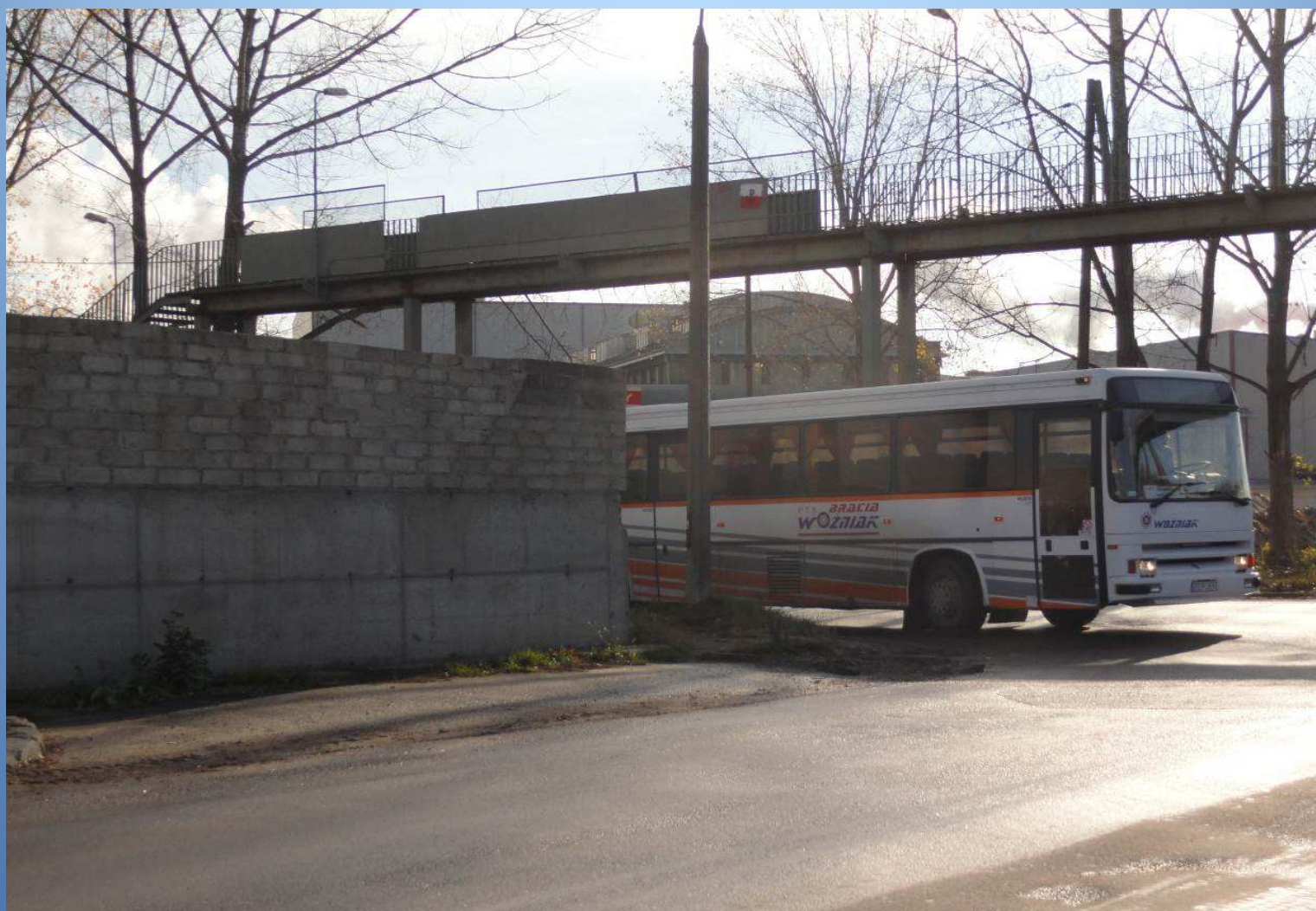
m. Końskie droga nr 749