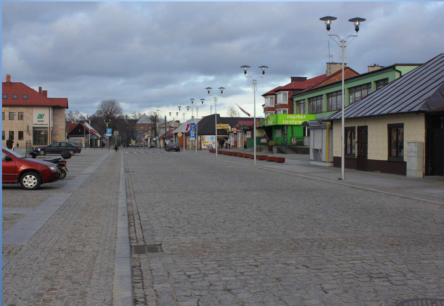
m. Daleszyce droga nr 764 - Rynek po rewitalizacji