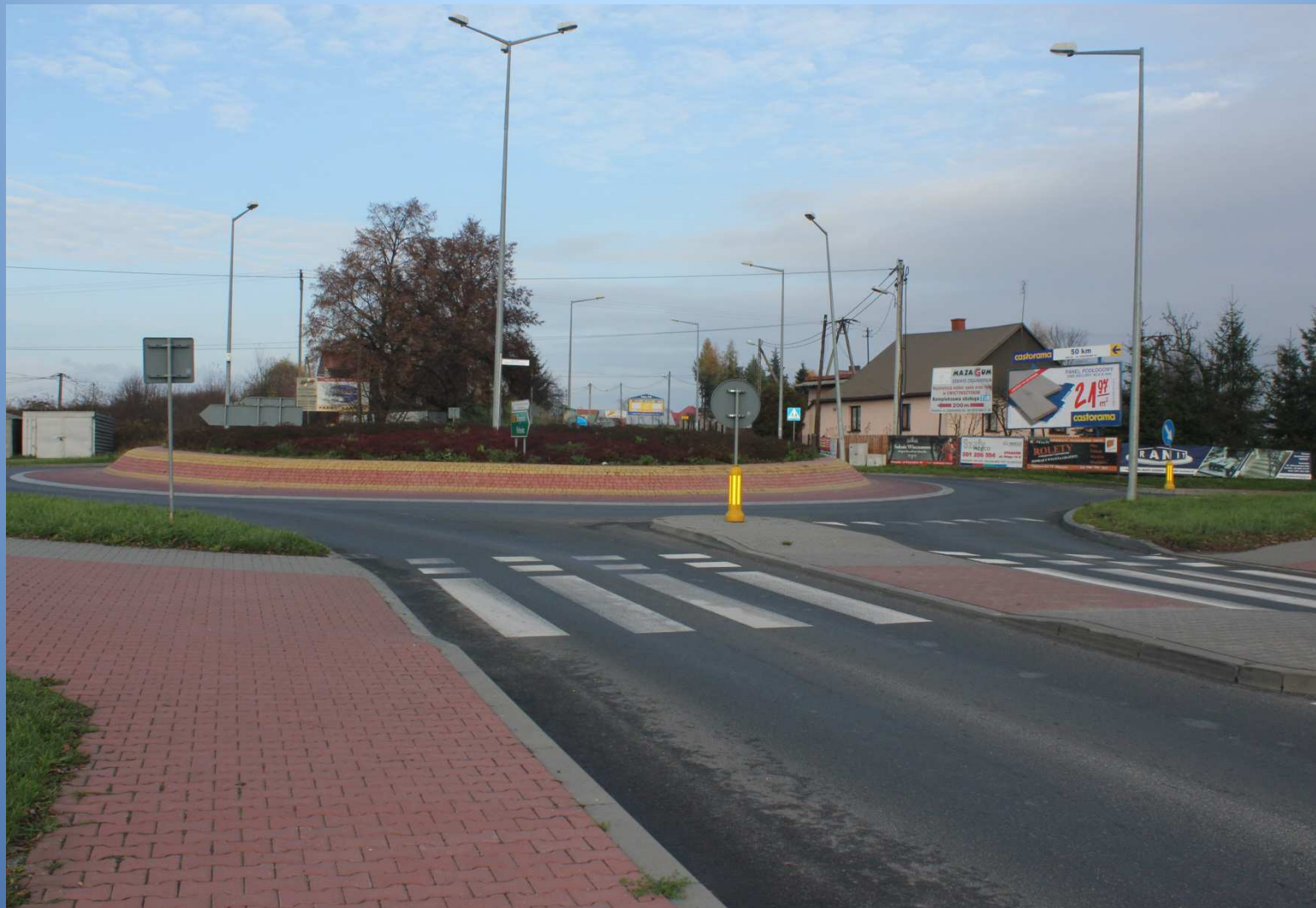
m. Staszów rondo na skrzyżowaniu dróg nr 764 i 757