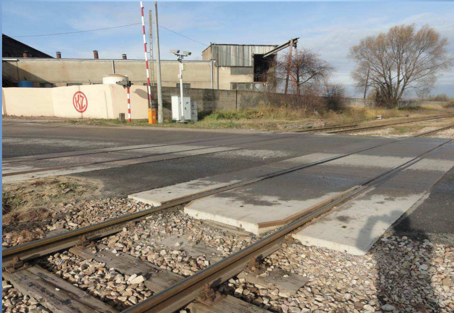
m. Końskie droga nr 749