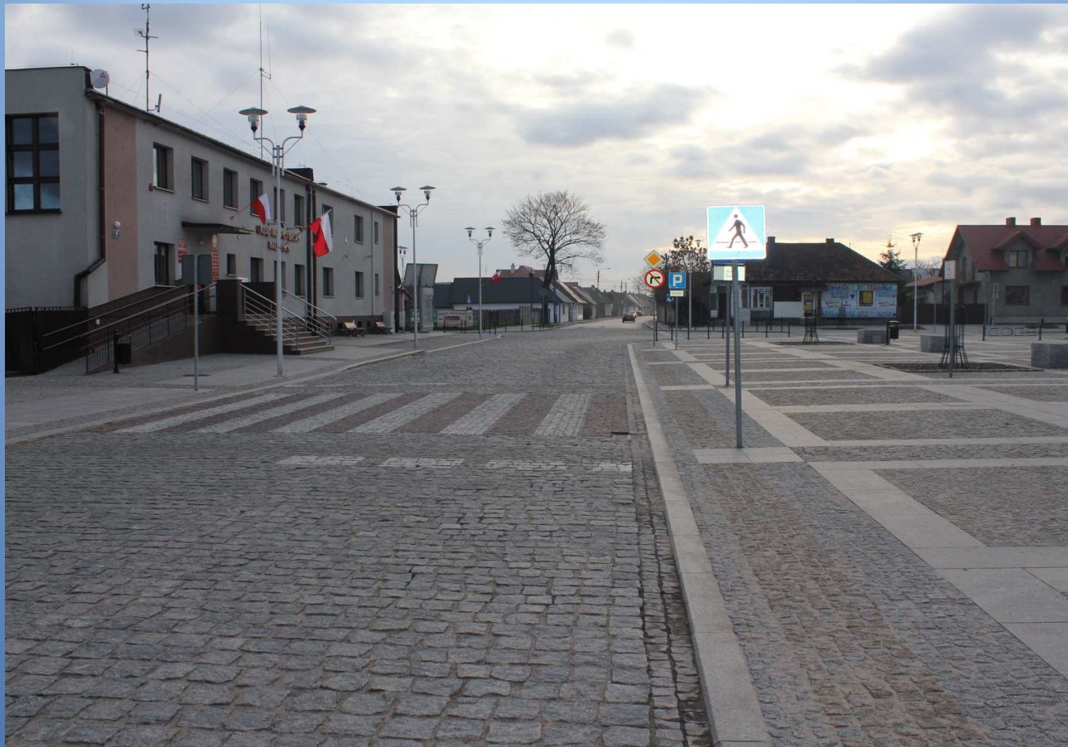
m. Daleszyce droga nr 764 - Rynek po rewitalizacji