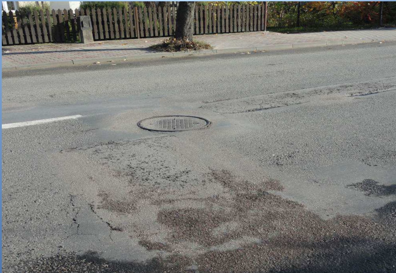
m. Końskie droga nr 746