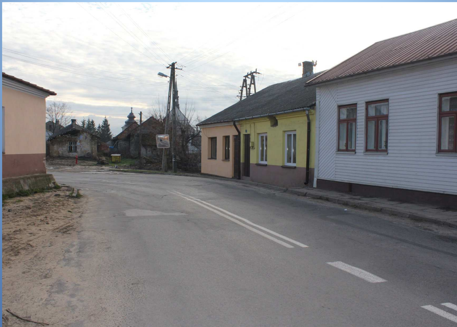
Droga nr 764 m. Raków