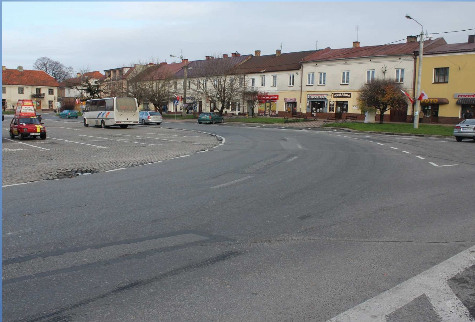
m. Staszów Rynek droga nr 764