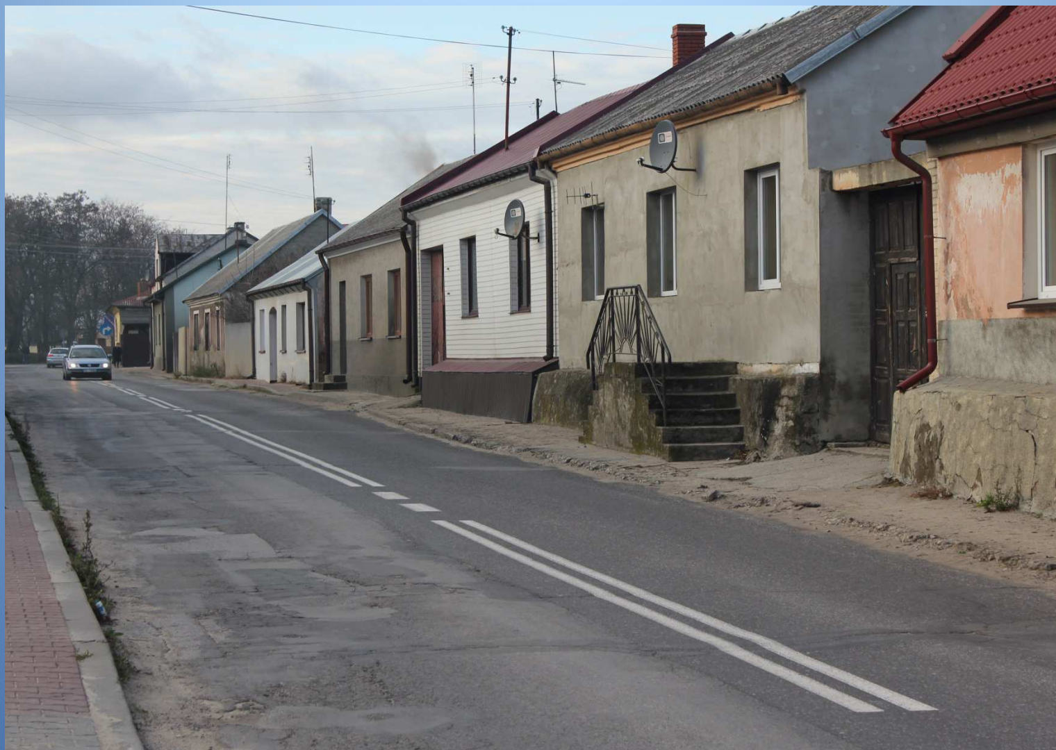
Droga nr 764 m. Raków