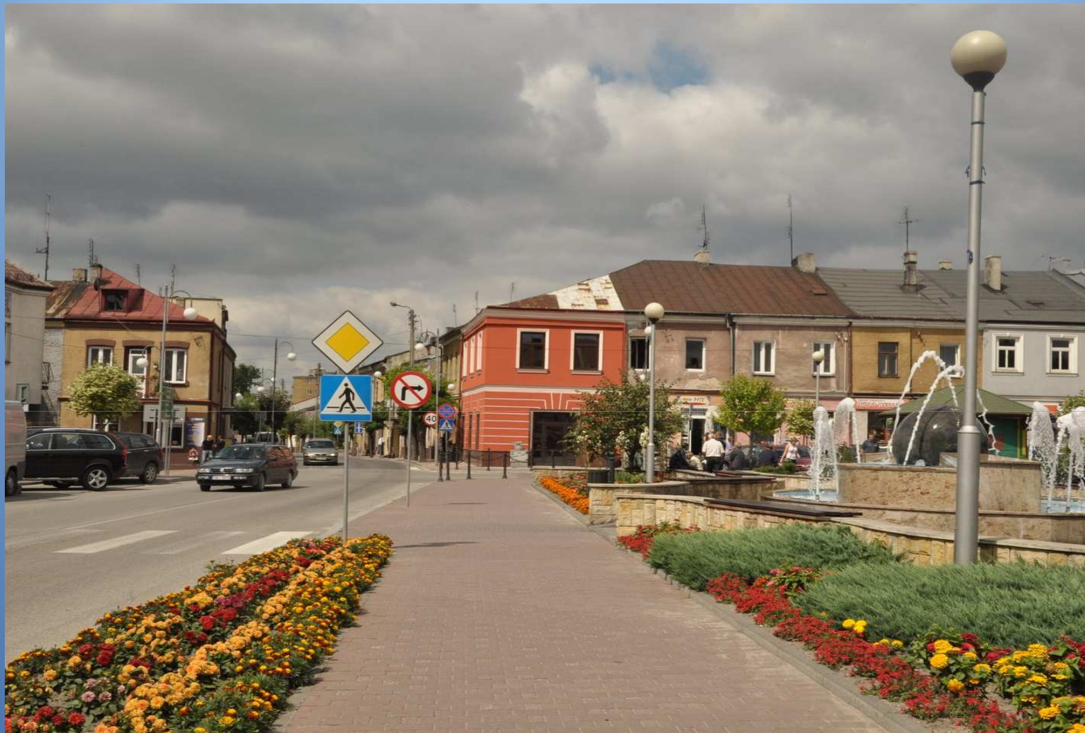
m. Chmielnik droga nr 765 Rynek